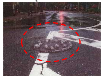
人孔(マンホール)からの溢水例