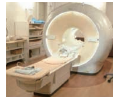
3.0テスラMR装置 Ingenia 3.0T PHILIPS社製