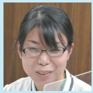
看護部看護師長 (看護師)