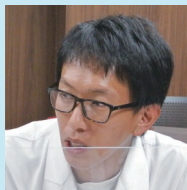
薬剤師主査 (薬剤師)