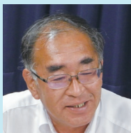
医事課長心得(事務)