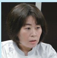
臨床検査部主査 (臨床検査技師)