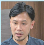
臨床工学部主任主査 (臨床工学技士)