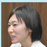
リハビリテーション科 主任技師 (作業療法士)