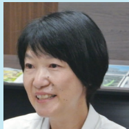
栄養指導部専門員 (管理栄養士)