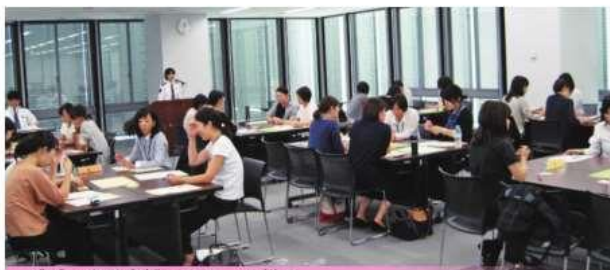
パパ・ママ支援セミナーの様子

ワーク・ライフ・バランスの実現に向け、それぞれのライフステージに合わせて利用できる支援制度が整っています。上司や仲間からの理解や協力もあるので、多くの職員が活用しています。