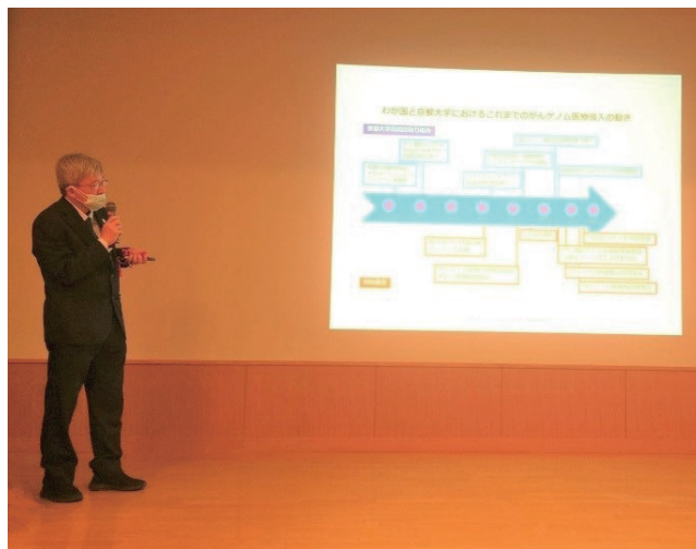
当院でがんゲノム医療について講演(2022年12月)

上記の3点を達成するためには、職員全員がやりがいを持って、充実した毎日を過ごしていただくことが大事だと思います。総合病院で初期研修やレジデント生活を過ごした若手医師に、大学で研究生活を過ごしたのち、再び総合病院のスタッフとして患者さんに寄り添う高度な医療を提供してもらうことが私の理想です。総長として職員や患者さんの声に耳を傾け、ワンチームとなって頑張りたいと思います。