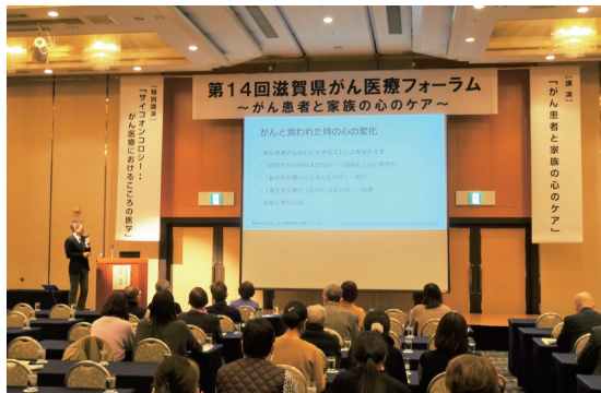
第14回滋賀県がん医療フォーラム

県民の皆様や医療関係者にご関心いただくため、毎年1回フォーラムを開催しています。令和4年度は令和5年2月18日(土)に第14回がん医療フォーラムを開催しました。