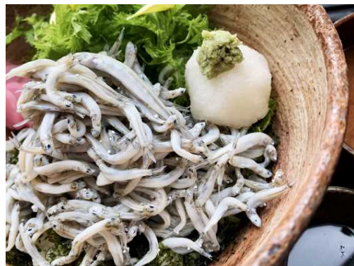
県産食材の魅力発信