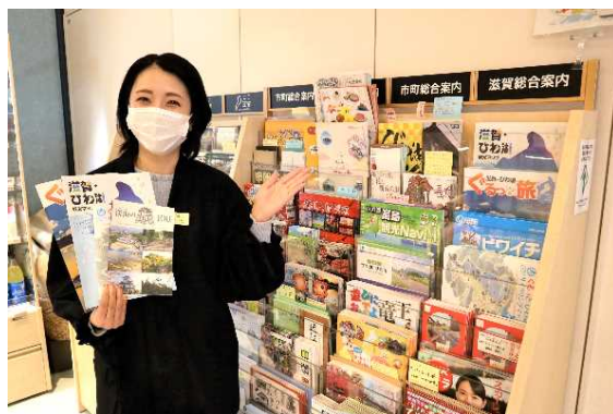
観光コンシェルジュの案内