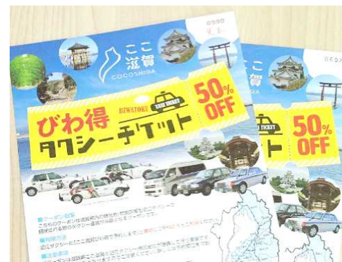
タクシー利用クーポン(R3試行)