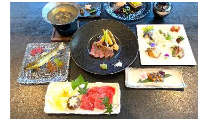
ディナーのコースメニュー【イメージ】