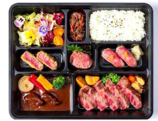
テイクアウト【イメージ】