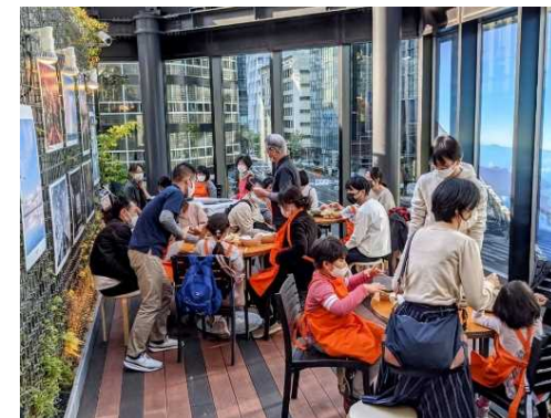
屋上テラスの活用