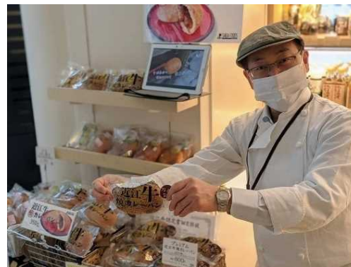
県内事業者による即売会