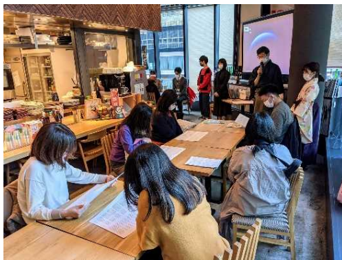
観光協会主催のイベント

学生によるお土産コンテストや県ゆかりの企業のPR、県人会等県ゆかりの方々との共同企画など、様々な主体と連携した企画催事を、東京本部とも連携して取り組みます。