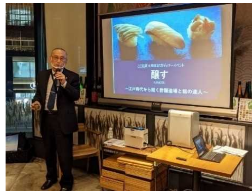
食の魅力を伝えるイベント