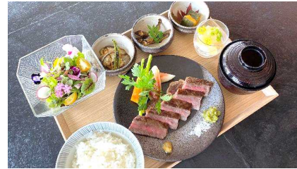
ランチメニューの定食【イメージ】