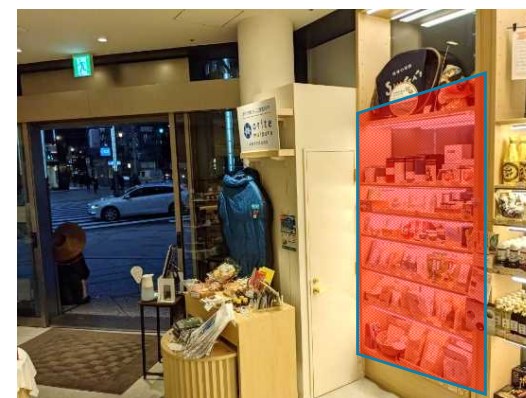
新商品・テストマーケティングコーナーの設置予定箇所