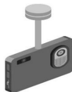
ドライブレコーダー

手頃な価格で購入することができ、設置も比較的簡単にできる！ 屋内用や屋外用もあり、自宅の防犯や家族の見守りに効果的。